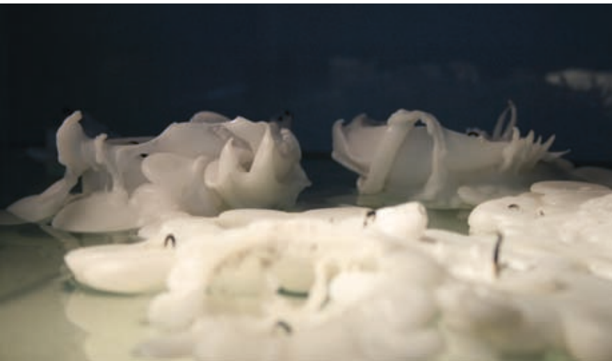
2008, weiße Kerzen, Glasbecken, 50 Liter Wasser, Tischgestell L105 × B67 × H103cm DA-Kunsthau Gravenhorst

2008, white paraffin candles, glass basin, 50 liters of water, stand L105 × W67 × H103cm DA-Kunsthau Gravenhorst