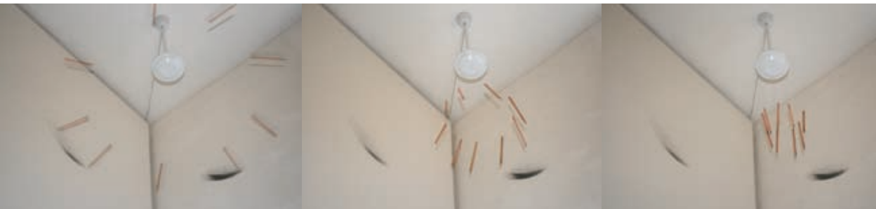
2008, Deckenventilator, 9 Bleistifte L105 × B105 × H25cm