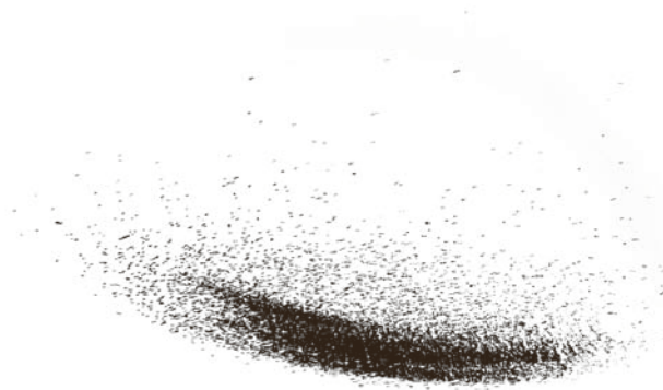
2008, ceiling fan, 9 pencils L105 × W105 × H25cm